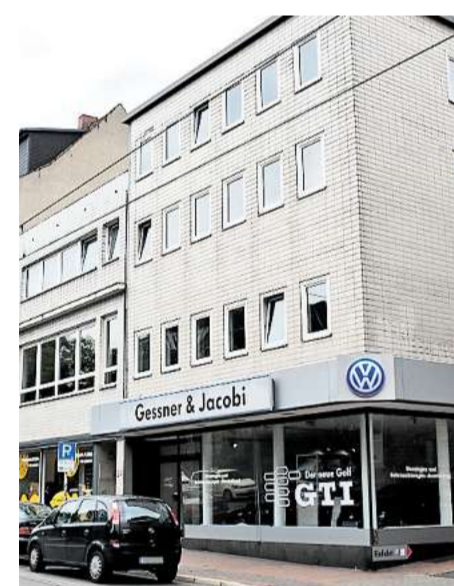
Platzprobleme: Im derzeitigen Schauraum kann die Firma nicht genug Wagen zeigen.

Derzeit verhandelt Jacobi mit der Stadt noch über die Details des geplanten Projekts. Auch die Denkmalpflege hat ein gewichtiges Wort mitzureden. Denn ein Teil der Bauten auf dem Firmengelände stammt noch aus dem 19. Jahrhundert sowie aus den zwanziger Jahren